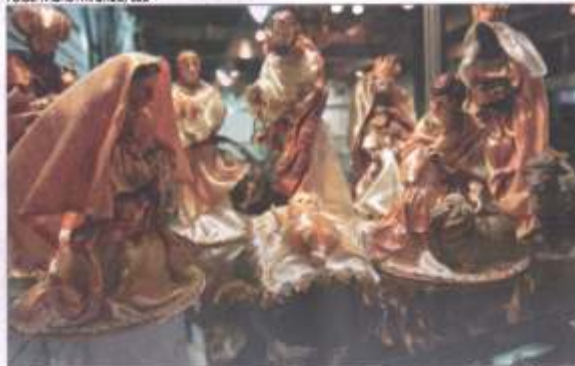
Presépios de vários estilos para celebrar a festa máxima do catolicismo