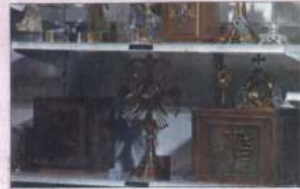
Mais de 190 expositores, entre nacionais e estrangeiros, apresentam diversos tipos de produtos usados nas cerimônias.

Além das novidades tecnológicas, o ExpoCatólica também oferece santos em madeira e outros materiais, novos desenhos de artigos para missas, como os oferecidos para Celebração, além de paramentos, desgustação de vinhos da Sobriety Vinhos, altares e livros. Hoje e amanhã, o evento é restrito a profissionais do setor. Nos dias 9 e 10, será aberto ao público, com ingressos a R$ 5 ou um quilo de alimento.